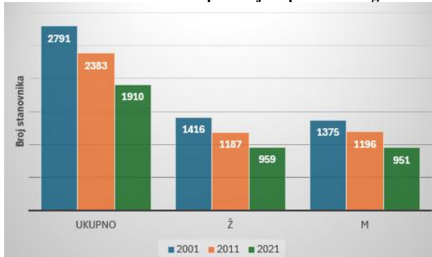
Grafikon 1: Stanovništvo na području Općine Hercegovac